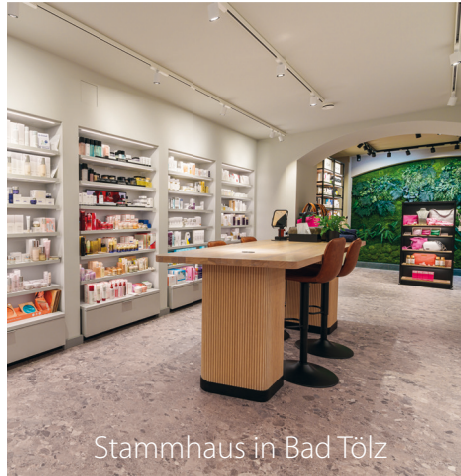
Stammhaus in Bad Tölz

Falls Sie Ihren Termin bei uns nicht einhalten können, bitten wir Sie uns spätestens 24h vorher darüber zu informieren.